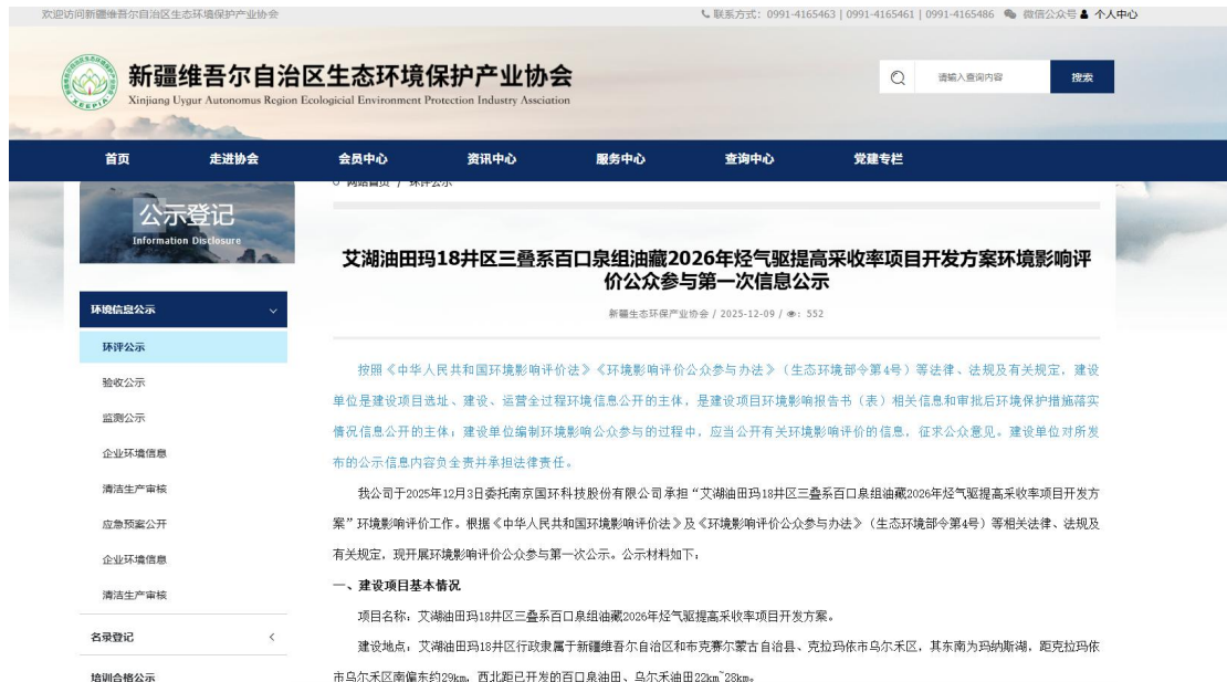
图 2.2-1 第一次网络公示