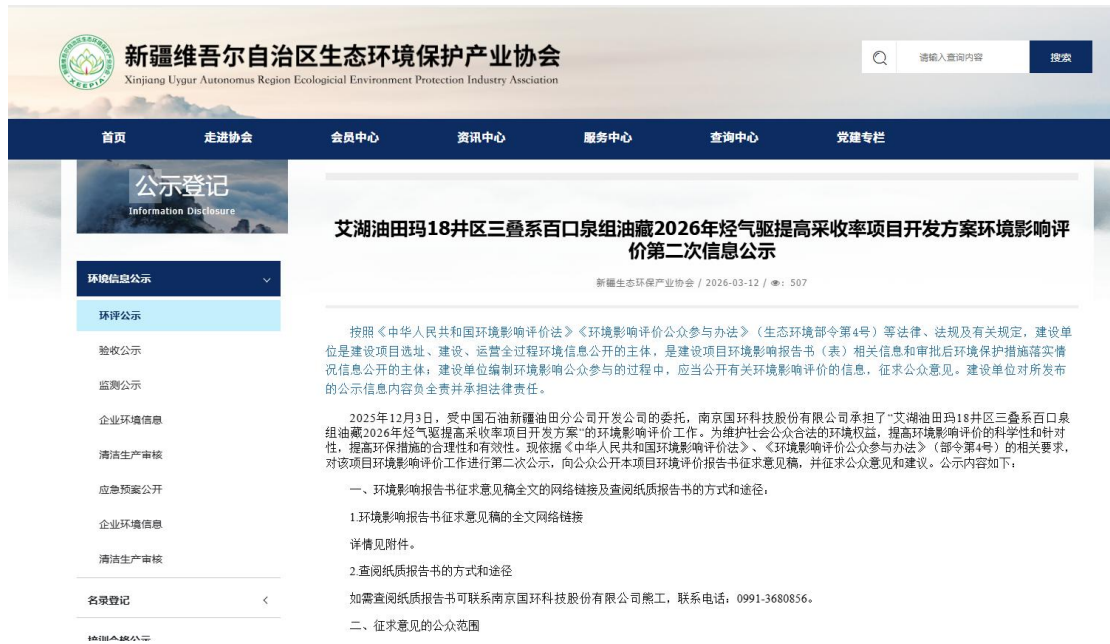
图 2 本项目征求意见稿网络公示截图