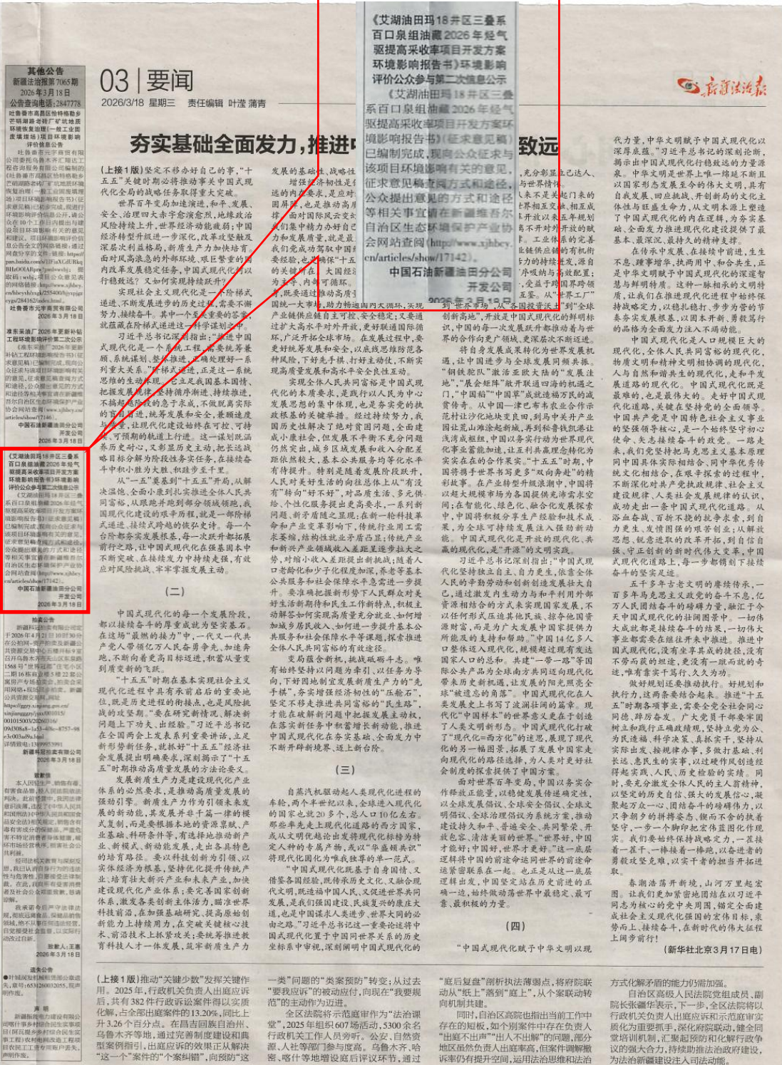
图3 本项目第一次报纸公示照片